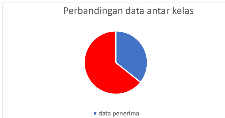
Gambar 2. Perbandingan data antar kelas

Pada tabel 5 berisi seluruh atribut yang ada pada data penerima dan calon penerima bantuan PKH di Bungaraya dengan penjelasan dari masing-masing atribut, yang berfungsi sebagai kelas atau target. Perbandingan data yang digunakan dapat dilihat pada gambar 3.