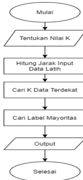
Gambar 2. Flowchart algoritma K-Nearest Neighbor

Algoritma KNN dimanfaatkan sebagai pemodelan yang menunjukkan akurasi, presisi, dan recall. Algoritma KNN mengalami berbagai tahapan pemrosesan seperti digambarkan flowchart pada Gambar 1.