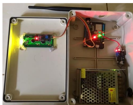
Gambar 2. Rangkaian Pengirim Data

Rangkaian pengirim data dapat dilihat pada gambar 2 berikut: