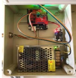
Gambar 3. Rangkaian Penerima Data

Rangkaian penerima data atau receiver bertujuan untuk melakukan uji penerimaan data yang dikirim oleh rangkaian sensor dan LoRA Shield. Perancangan receiver yang terdiri dari komponen power supply yang berperan sebagai sumber daya, generator sebagai stabilizer tegangan dan arduino uno untuk mendeteksi lingkungan input dan juga Lora Shield sebagai penerima data hasil keluaran monitoring kualitas udara ke rangkaian receiver. Rangkaian receiver dapat dilihat pada gambar 3.