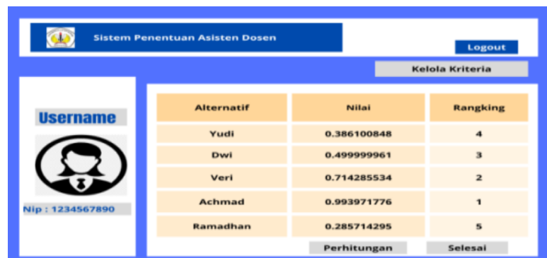
Gambar 4. Hasil Perankingan

Setelah itu lakukan proses perankingan untuk mendapatkan nilai yang tertinggi menggunakan metode TOPSIS, tekan menu perhitungan dan dapatkan hasil dari perhitungan tersebut, seperti gambar berikut