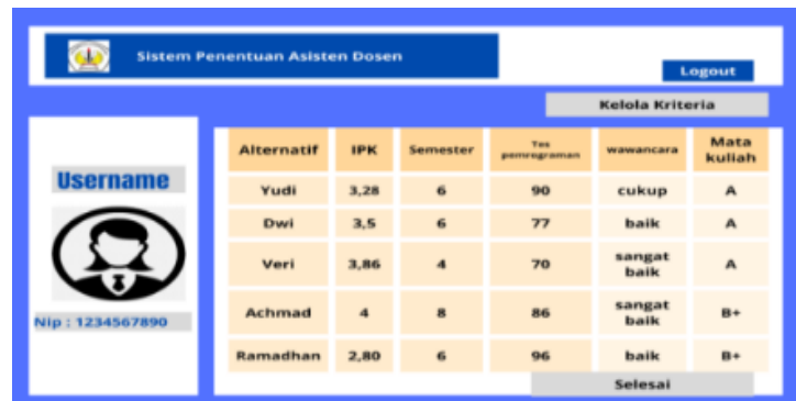
Gambar 3. Isian Nilai Kriteria

Tampilan beranda berisi menu untuk mengelola kriteria, dan seorang pengguna mengisi data yang terdiri dari alternatif, ipk, semester, tes pemrograman, wawancara dan nilai matakuliah, setelah itu tekan selesai.