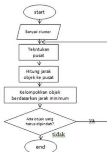
Gambar 1. Tahapan Clustering

Clustering merupakan klasifikasi tanpa pengawasan dan merupakan proses partisi sekumpulan objek data dari satu set menjadi beberapa kelas. Hal ini dapat dilakukan dengan menerapkan berbagai persamaan dan langkah-langkah mengenai jarak algoritma, yaitu dengan Euclidean Distance [6]. Analisis kluster ialah algoritma yang dipakai untuk membagi rangkaian data menjadi beberapa grup berdasarkan kesamaan-kesamaan yang telah ditentukan sebelumnya [7]. Dalam menentukan cluster berdasarkan data yang telah tersedia, dibutuhkan sebuah flowchart untuk memudahkan dalam menentukan alur perhitungan sebagai alur untuk menemukan hasil dari penerapan cluster terhadap data yang akan diproses. Berikut adalah flowchart dalam menentukan cluster dengan K-Means [8].